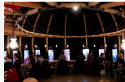
Perhaps all the dragons... © Berlin

Quote = 'Perhaps all the dragons in our lives are princesses who are only waiting to see us act, just once, with beauty and courage'