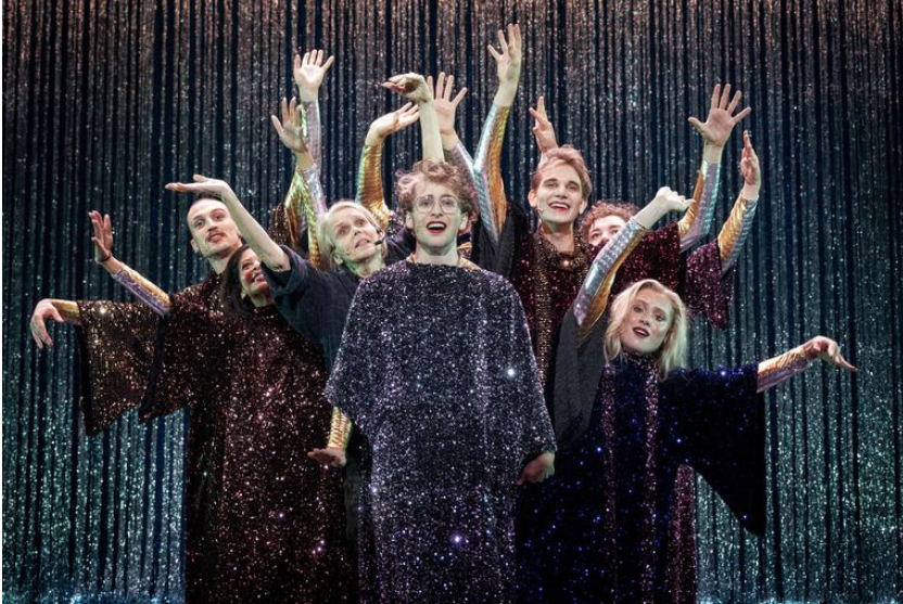
Een leuk avondje uit (Theater Artemis) voor klein

Een gefluisterde musical met emoties die op de zaaldeuren komen bonzen. Het is een idee dat enkel kan ontspruiten aan de geest van regisseur Jetse Batelaan. Batelaan en zijn gezelschap scheren alweer hoge toppen met deze productie die draait rond de vraag hoe we met emoties moeten omgaan en wat er gebeurt als we ze onderdrukken. Een vat vol fantasie, humor én denkvoer: jeugdtheater van de bovenste plank.