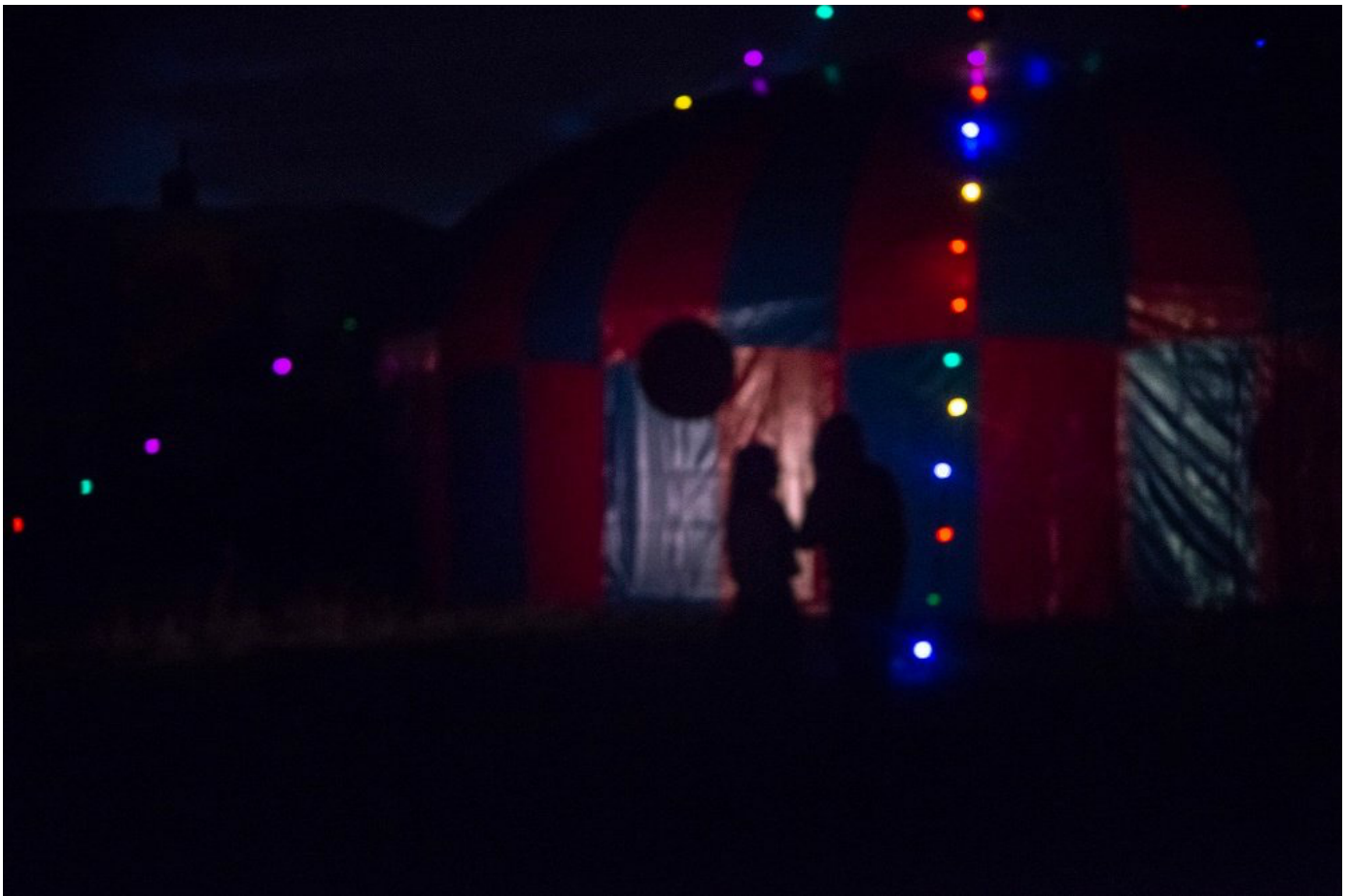
Berlin © Luis Xertu

Berlin brengt al sinds 2003 de bevreemdende realiteit in beeld, vaak geflankeerd door livemuziek of livespel. Nu leggen ze de realiteit naast zich neer en ensceneren fictieve bevreemding. Dat werkt pas als die enscenering het hypnotiserende ritme van de muziek volgt. In de andere gevallen doe je wat de camera tijdens het eerste zeetafereel doet, je laat je oog zakken van de hemel (het scherm) naar de aarde (de vloer) waar de maestro's zitten en je geniet van hun geweldige muziek - flanierend langs jazz, krautrock en elegant klassiek - die doet dromen, dralen, dansen en denken aan die ruiszone tussen het leven en de dood. ●