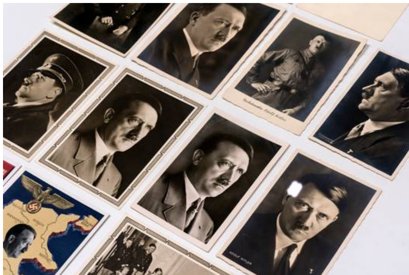
▲ Design van het Derde Rijk in het Design Museum.

Het Design Museum in Den Bosch weet van een beladen onderwerp over het design van Nazi-Duitsland een afgewogen expositie te maken die internationaal veel aandacht trekt. De stevast uitverkochte expositie laat zien dat het Derde Rijk werkelijk alles omvattend was. Het regime bemoeide zich overal mee. Ontwerpers en vormgevers werkten mee aan de vormgeving van het kwaad. Een overvolle zaal op de eerste verdieping laat de voorwerpen zien, een film op de tweede geeft context. Al blijft het een gemis dat er geen catalogus is gemaakt.