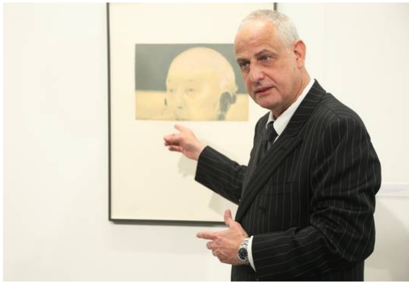
▲ Luc Tuymans.