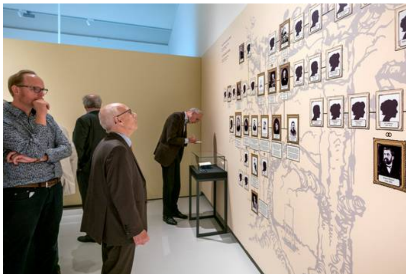
▲ Tentoonstelling Van Goghs Intimi in het Noordbrabants Museum.