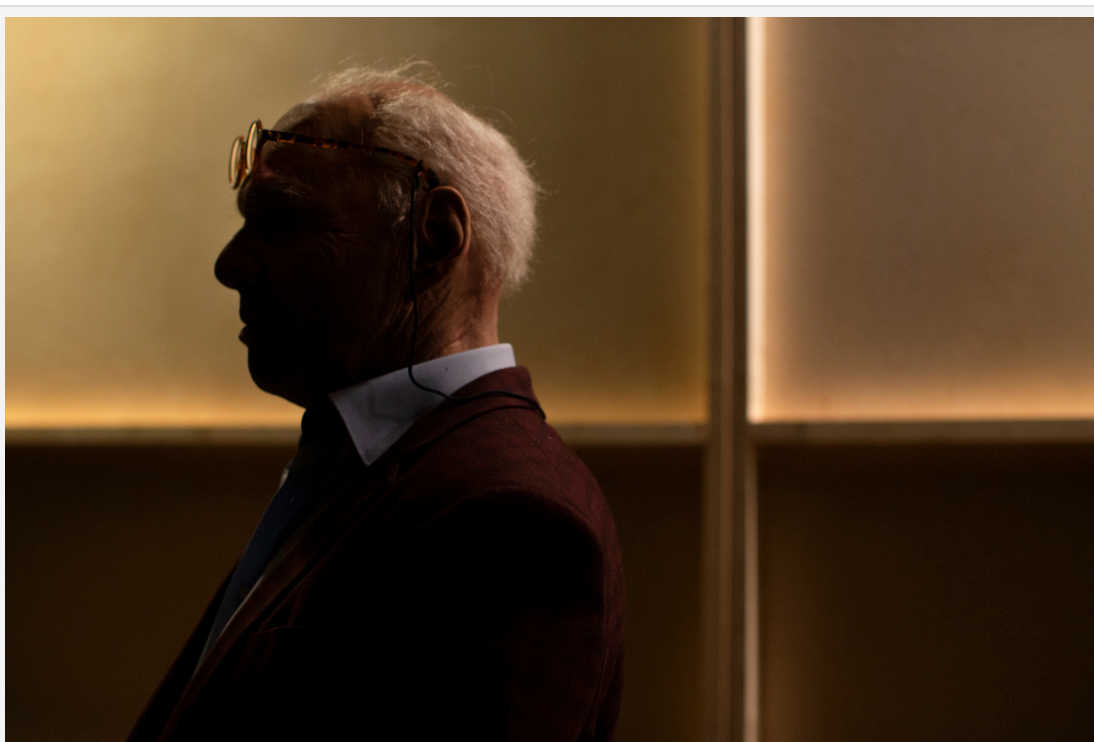
Berlin, True Copy [Horror Vacui #5]