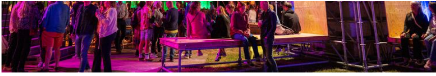
Festival Boulevard in het Zuiderpark in Den Bosch.